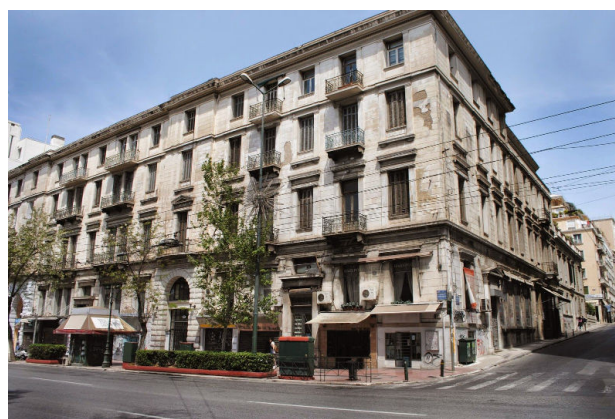
Μέγαρο Σλήμαν - Μελά που στεγάζει το INTEAL