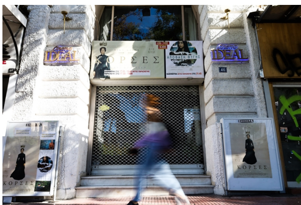
Είσοδος κινηματογράφου INTEAL